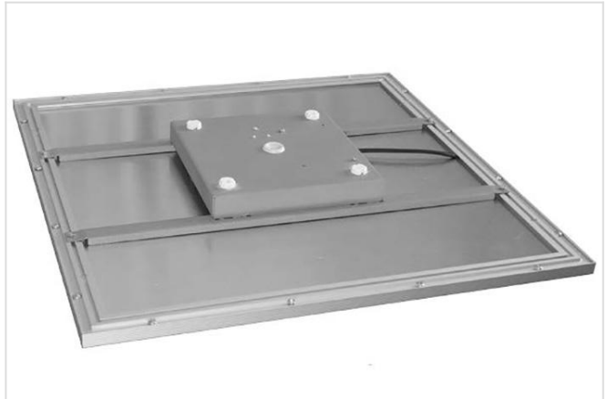
Q.LED pendel/opbouw - top

Strak minimalistisch aluminium LED paneel geschikt voor inbouw, opbouw- of pendelmontage. Hoog lichtdoorlatend acrylaat lichtvlak met een uitermate hoge gelijkmatigheid. LED driver in behuizing van de armatuur.